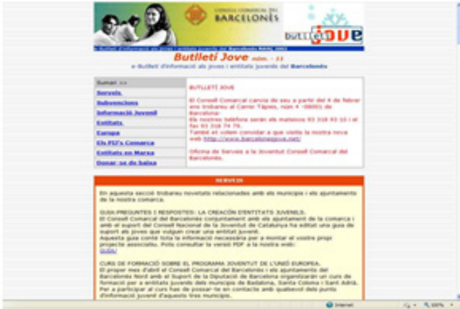
Butlletí Jove al 2002