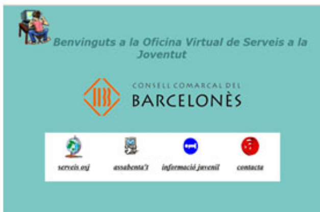
Barcelonesjove.net al 2000