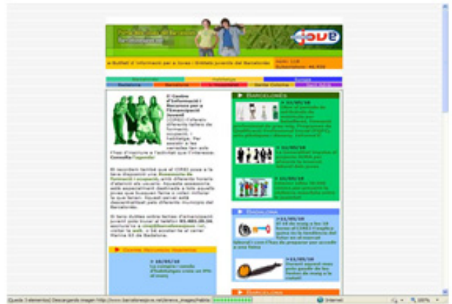
Butlletí Jove al 2009

Originàriament només és tractava del primer butlletí electrònic de caràcter juvenil publicat a Catalunya.