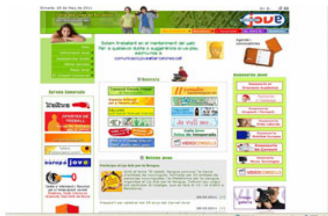
Barcelonesjove.net al 2007

Dos anys més tard, el 2001, neix la web del Portal dels Joves del Barcelonès amb l'objectiu de convertir-se en una sòlida eina de treball per a tots els joves de la comarca que necessiten informació i assessorament sobre els temes que més els preocupen: ocupació, formació, habitatge, consum i mobilitat europea. Les consultes d'aquests temes es resolen mitjançant assessoreries virtuals que, des de la seva creació, han donat resposta a 20.000 consultes on-line.