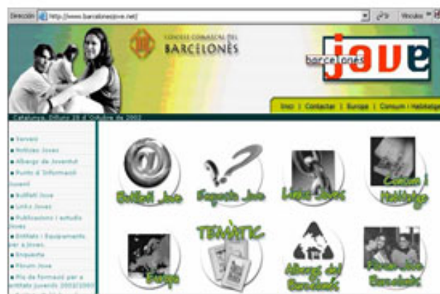
Barcelonesjove.net al 2002