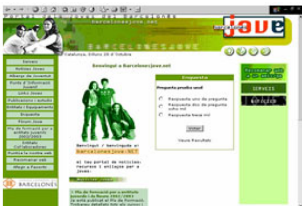
Barcelonesjove.net al 2005